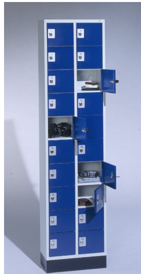
Abbildung mit Astralonnummernschild

www.stahlschrank.com info(at)stahlschrank.com